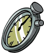
ストップウォッチ